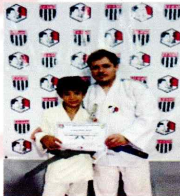
Figuras 1 : Treino de Judô. Fonte: autoria própria Figuras 2 : Treino de Judô/ Figuras 3 : Treino de Judô Fonte:autoria própria Figuras 3 : EXAME GRADUAÇÃO Fonte: autoria própria Figuras 4 : EXAME GRADUAÇÃO Fonte: autoria própria

Conclui-se que as atividades em outubro, foram muito produtivas visto a motivação e empenho das crianças.